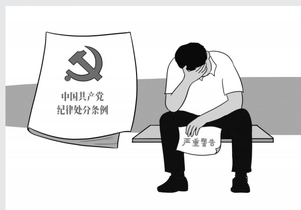
2019年6月13日，张某受到党内严重警告处分。