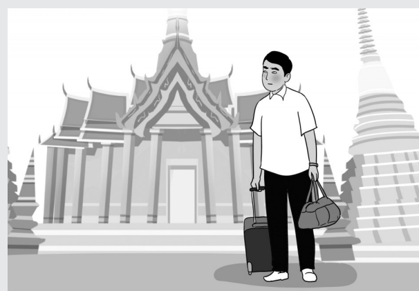
2016年4月至2019年2月，张某谎称家中有事向单位请假后，先后多次前往泰国、越南和中国香港、澳门等地处理私事。