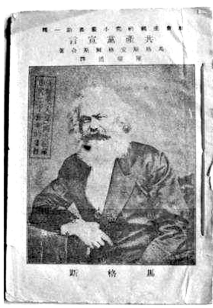
中共“一大”会址纪念馆收藏的《共产党宣言》