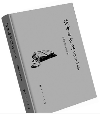
《读书的方法与艺术》中国图书评论学会 编 人民出版社

自一带一路（丝绸之路经济带和21世纪海上丝绸之路）倡议提出后，国内外对其开展了热烈的讨论，进行了许多深入研究。应该如何认识一带一路的内涵与意义？本书是由中国社会科学院国际研究学部推出的一本集刊。围绕着一带一路倡议，探讨其内涵和意义，并从综合视角、地区视角和外交视角出发，深入阐释一带一路倡议下的中国发展战略布局。其中既有理论辨析，也有对策解答。在引领和推动国内相关国际问题的研究方面，颇具价值。