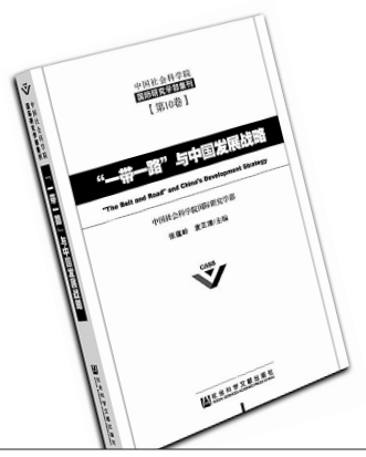
《一带一路与中国发展战略》张蕴岭 袁正清 主编 社会科学文献出版社

自一带一路（丝绸之路经济带和21世纪海上丝绸之路）倡议提出后，国内外对其开展了热烈的讨论，进行了许多深入研究。应该如何认识一带一路的内涵与意义？本书是由中国社会科学院国际研究学部推出的一本集刊。围绕着一带一路倡议，探讨其内涵和意义，并从综合视角、地区视角和外交视角出发，深入阐释一带一路倡议下的中国发展战略布局。其中既有理论辨析，也有对策解答。在引领和推动国内相关国际问题的研究方面，颇具价值。