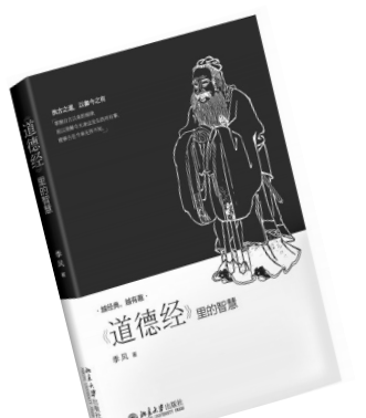
《道德经里的智慧》季风 著 北京大学出版社

汲取祖先智慧，回归传统文化。本书将老子的《道德经》划分为十一个主题，对每一主题从多角度进行深入解读。为便于读者理解，书中还穿插了古人的践行实例以供参考。读懂《道德经》，能够让人更好地为人处世。希望广大读者都能够从传统文化中汲取养分，从而更好地指导人生。